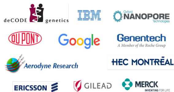
图11: 至少拥有2位2017年HCR的企业

基于HCPs的发表情况,来自企业的作者在HCRs榜单中的占比已相当可观。图11中的企业在2017年的HCRs榜单中均至少拥有2个席位。有些作者来自制药或生物技术公司,相关研究领域包括药理学与毒理学、分子生物学与遗传学、免疫学及微生物学。还有一些在IT公司从事研究工作,发表了计算机科学和工程领域的高影响力论文。此外,在农业科学、物理学以及植物与动物科学等领域也能发现企业界的HCRs。总的来说,在企业界,美国拥有30位HCRs,英国有8位,爱尔兰有6位。